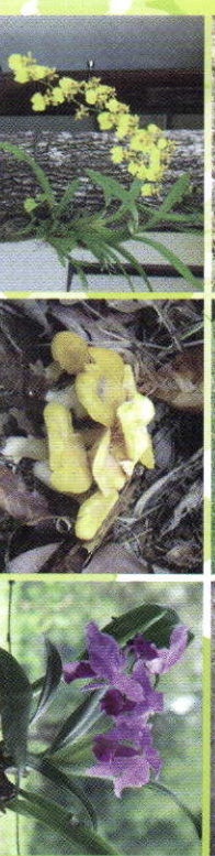
งานศึกษาและพัฒนาเกษตรกรรม