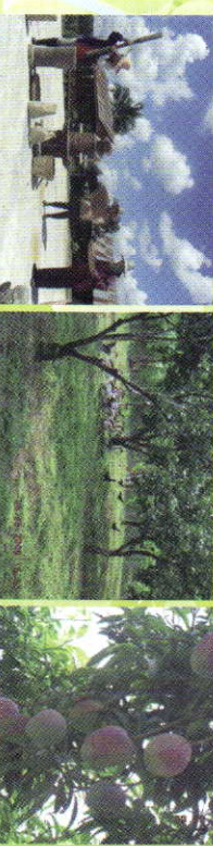
งานศึกษาและพัฒนาตำบลศิลา