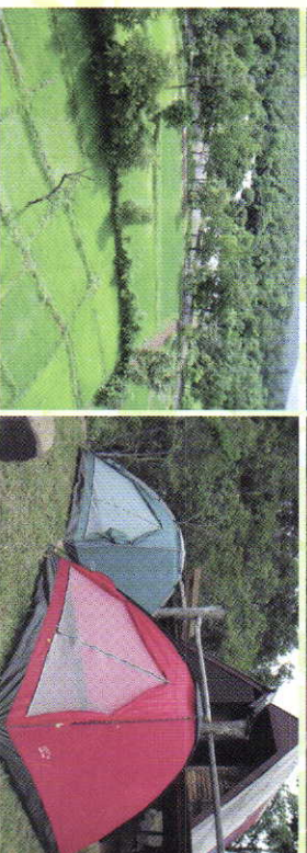
งานศึกษาและพัฒนาป่าไม้